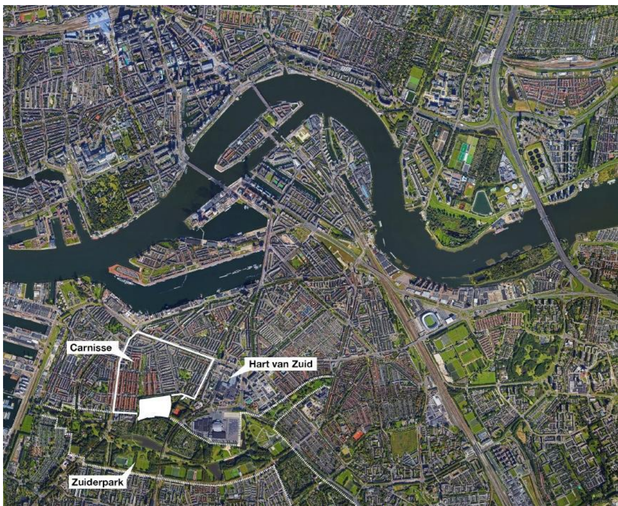
Figuur 1. Situering Carnisse Eiland te Rotterdam (Keizer Koopman et al., 2021)

Het gevolg van bovenstaande ontwikkelingen is dat factoren voor de ervaring van thuisgevoel, als hechting en sociale cohesie, onder druk komen te staan door de verdwijning van betekenisvolle plekken, de grote mate van verhuisbewegingen en een toename in particuliere verhuur met een verwacht negatief effect op het buurtcontact tot gevolg. Dit staat haaks op de energie die door overheden en de buurt de afgelopen jaren in de wijk is gestoken om de leefbaarheid te verbeteren. In dit onderzoek staat thuisgevoel centraal aangezien het de lading dekt voor zowel de fysieke elementen van buurten als de beleving en binding daarvan door bewoners. Daarnaast wordt inzichtelijker aan welke knoppen betrokken professionals kunnen draaien om het thuisgevoel bij gevestigde bewoners te behouden.